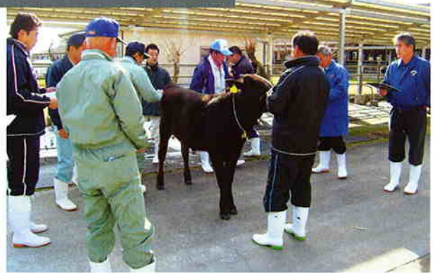
直接検定候補牛の選定