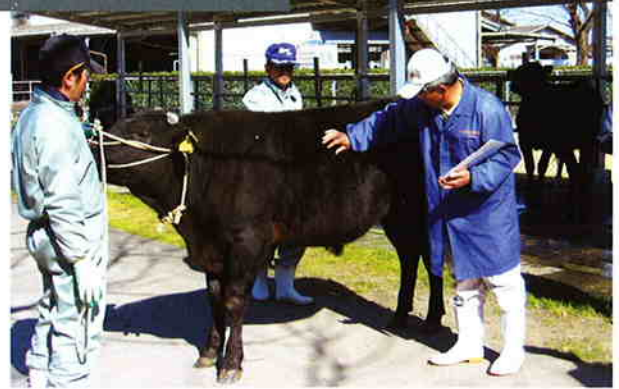
直接検定終了立会