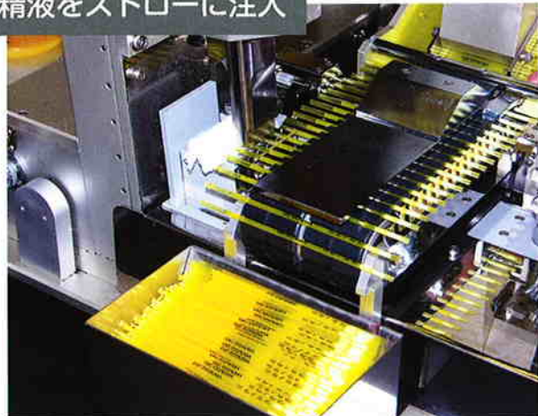
精液をストローに注入