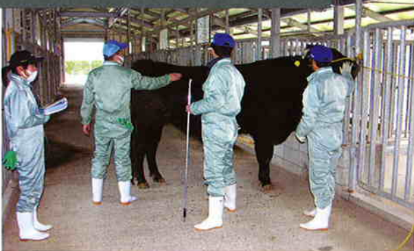
体型測定及び ボディーコンディションチェック