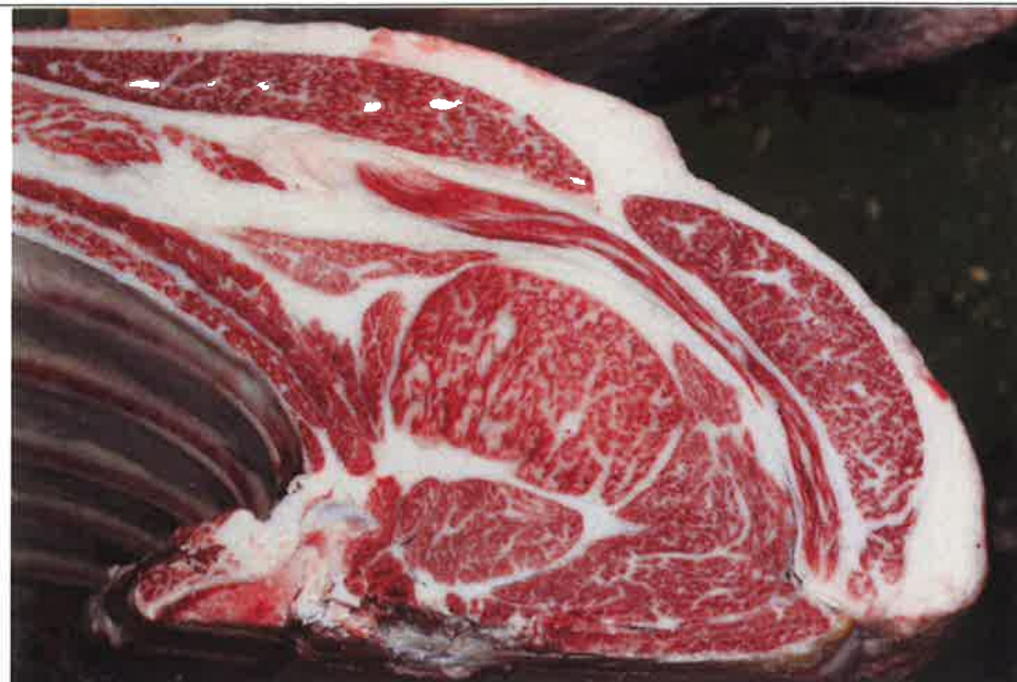
No 2 血統：勝平正×福之国 格付成績：A-5 BMSNo 8