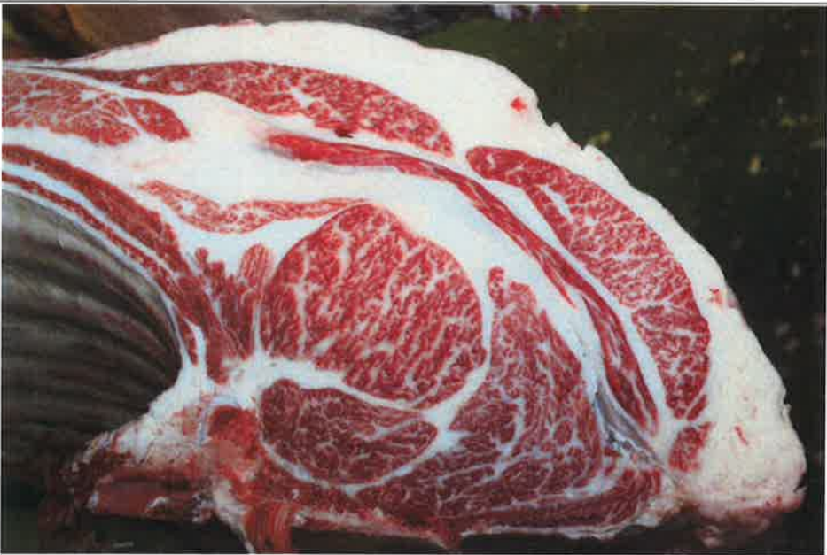
No 8 血統：福之国×安平 格付成績：A-4 BMSNo 6