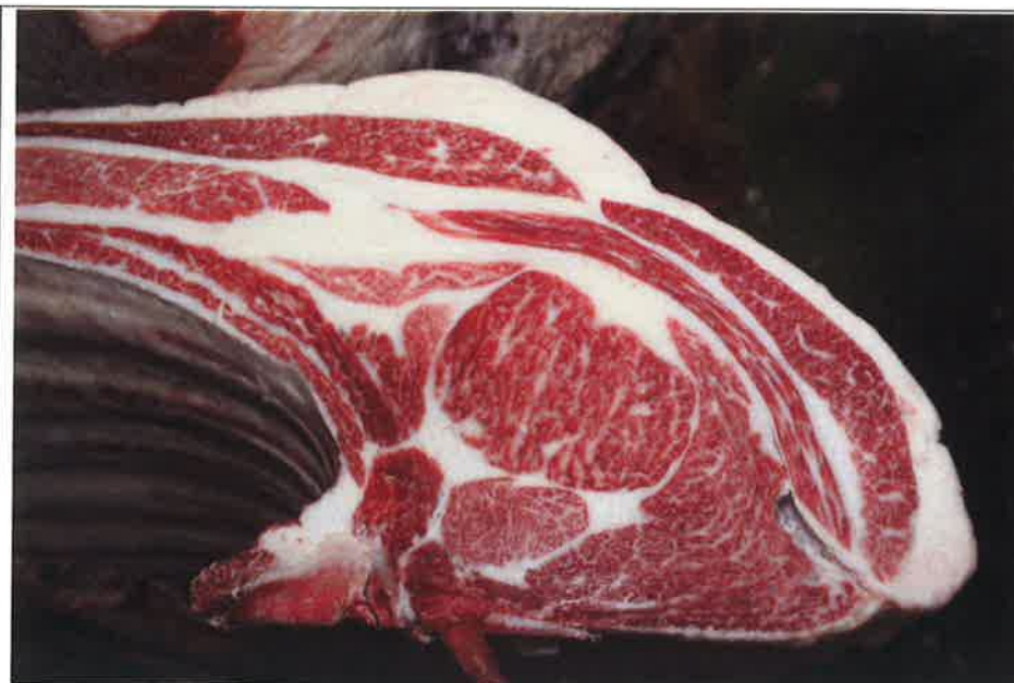
No 11 血統：福之国×安平 格付成績：A-5 BMSNo 8