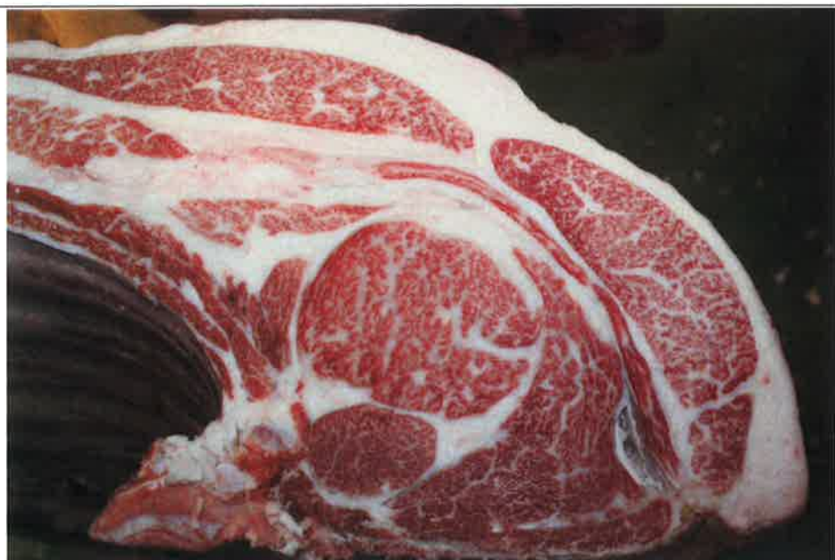
No 3 血統：勝平正×福桜 格付成績：A-5 BMSNo 10