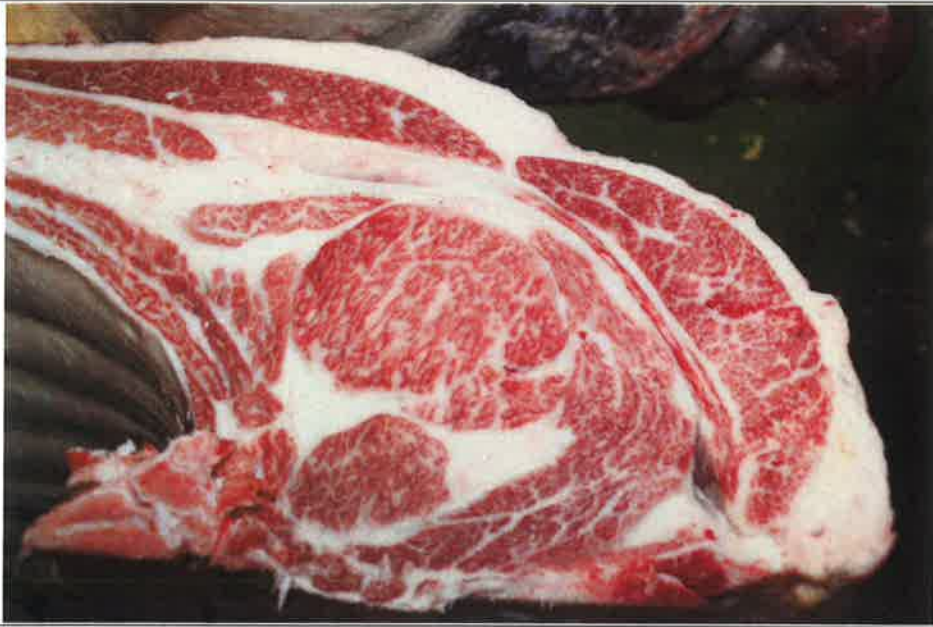
No 6 血統：勝平正×福桜 格付成績：A-5 BMSNo 9