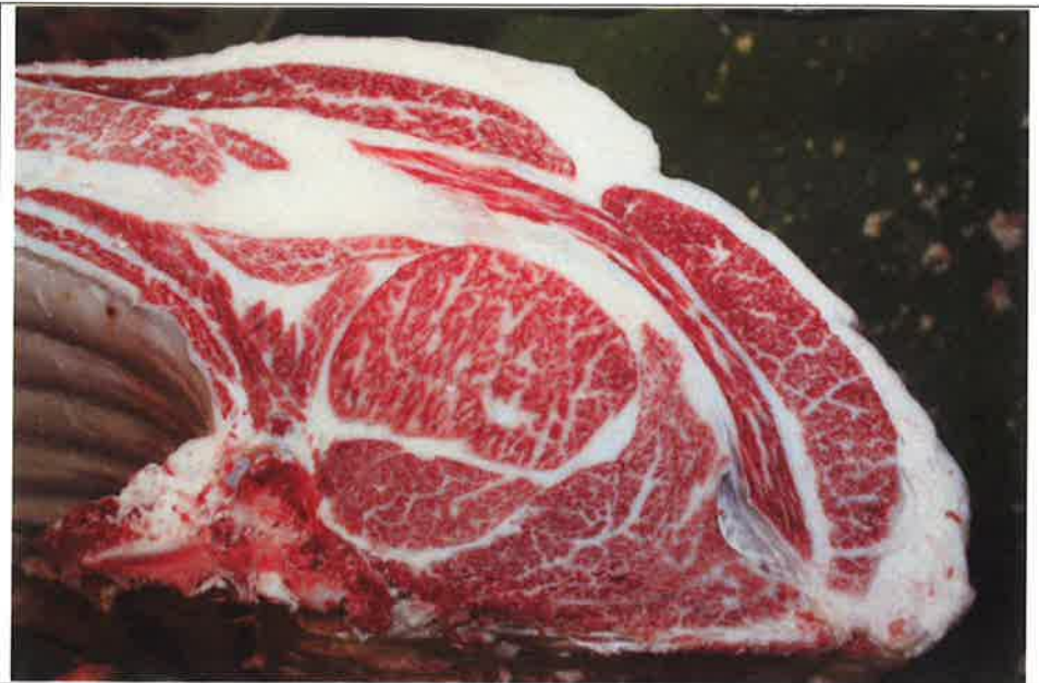
No 7 血統：秀菊安×上茂福 格付成績：A-5 BMSNo 9