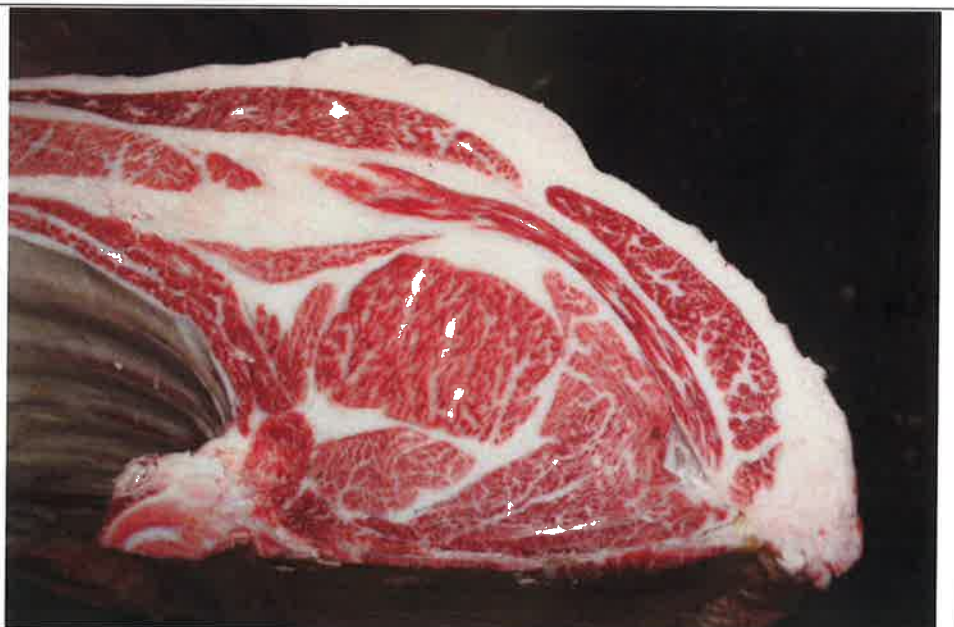
No 9 血統：福之国×安平 格付成績：A-5 BMSNo 9