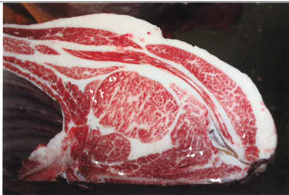
No 4 血統：秀菊安×忠富士 格付成績：A-5 BMSNo 8