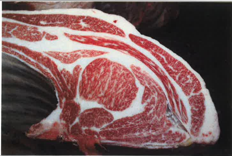
No 10 血統：美徳国×安平 格付成績：A-4 BMSNo 7