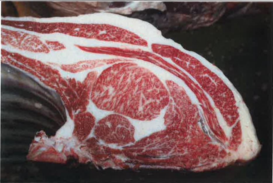
No 12 血統：美徳国×安平 格付成績：A-4 BMSNo 7