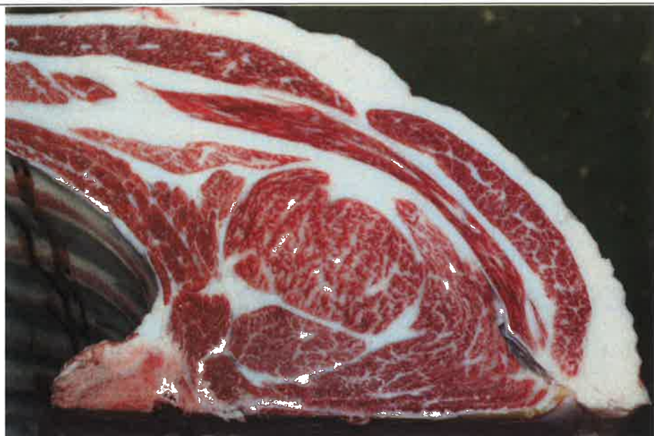
No 1 血統：福之国×福桜 格付成績：A-4 BMSNo 7