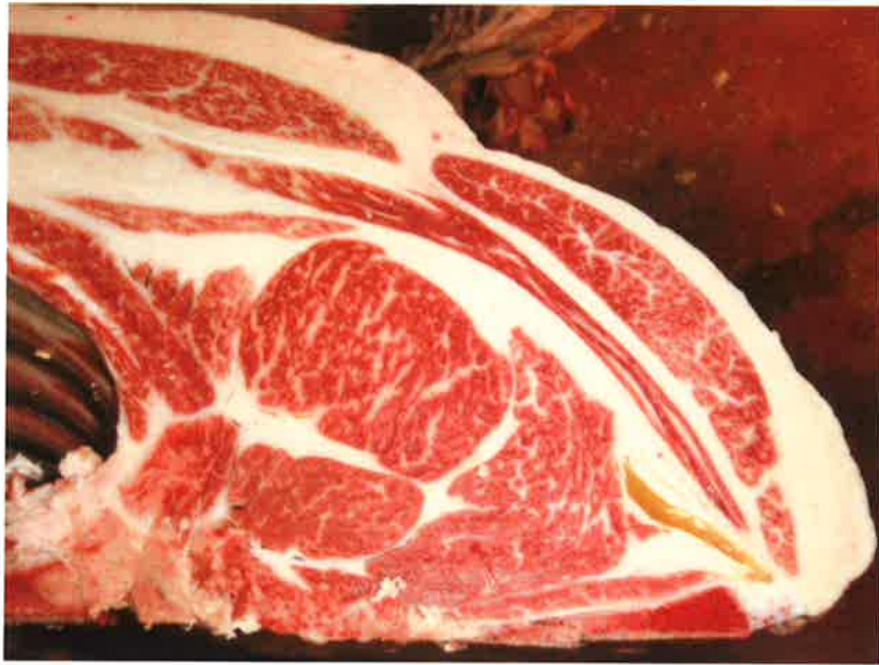
No 5 血統：勝平正×安福久 格付成績：脂肪交雜 2 + A-4