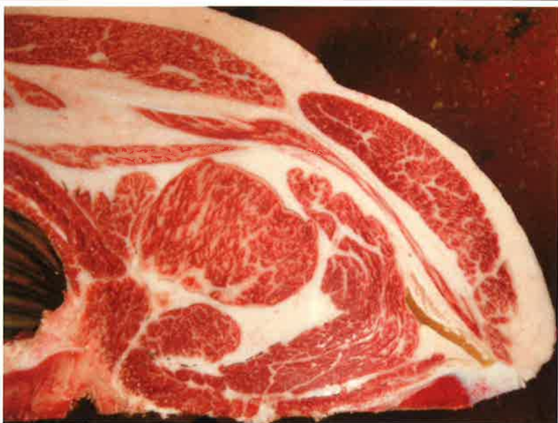
No 3 血統：忠富士×安平 格付成績：脂肪交雑5 A-5