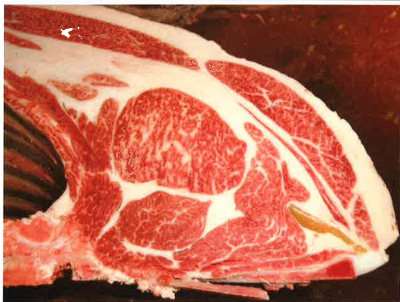
No 1 血統：勝平正×安平 格付成績：脂肪交雑5 A-5