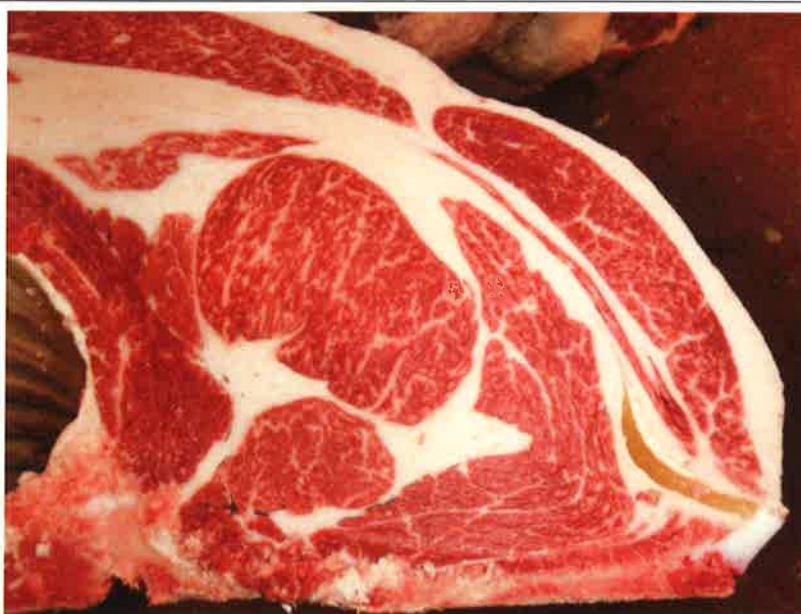
No 4 血統：勝平正×日向国 格付成績：脂肪交雑2* A-4