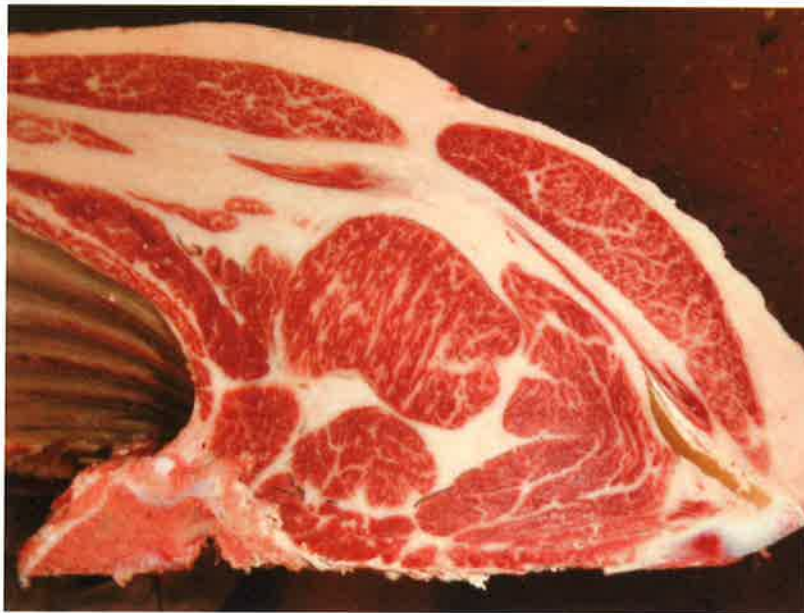
No 7 血統：忠富士×茂勝 格付成績：脂肪交雜 3 - A-5