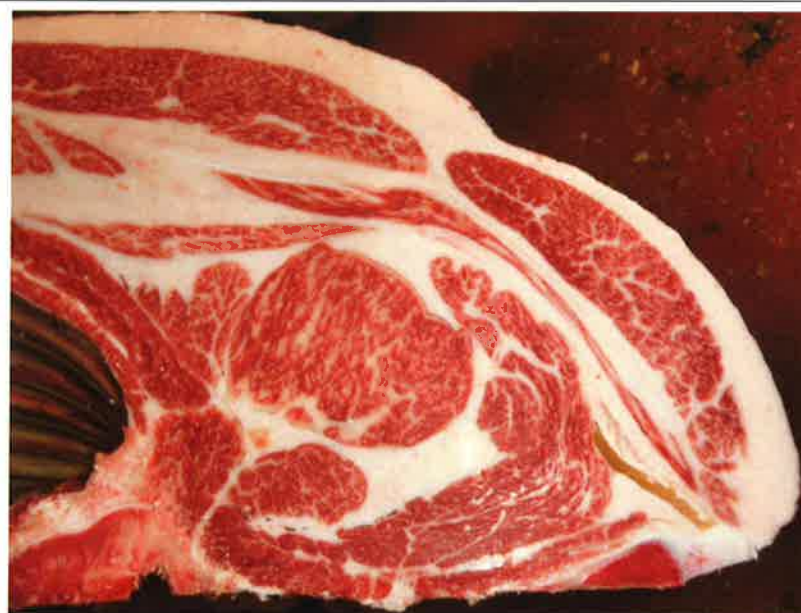
No 2 血統：秀菊安×福之国 格付成績：脂肪交雑4 A-5