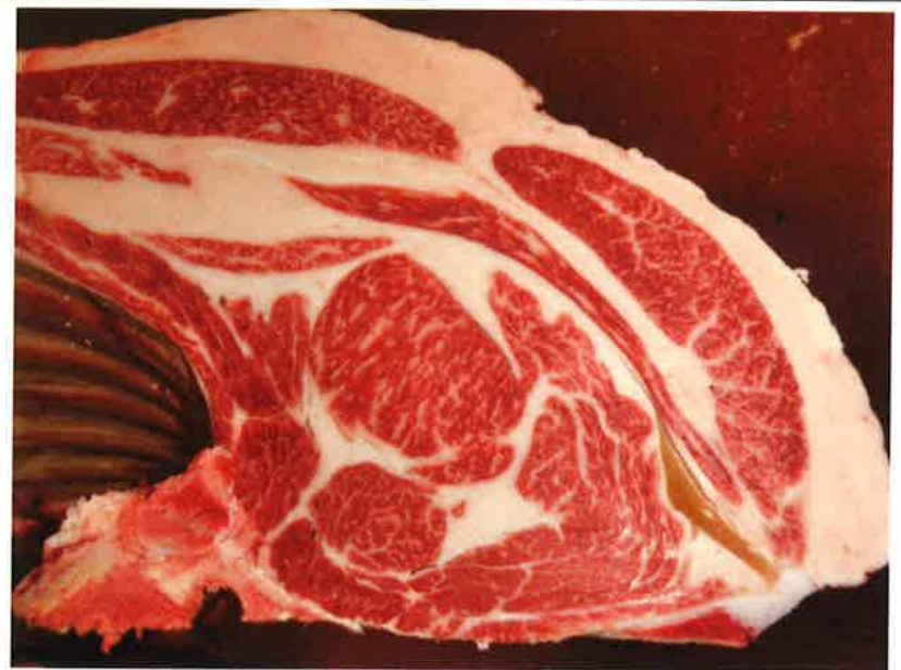
No 8 血統：勝平正×安平 格付成績：脂肪交雜 2 + A-5