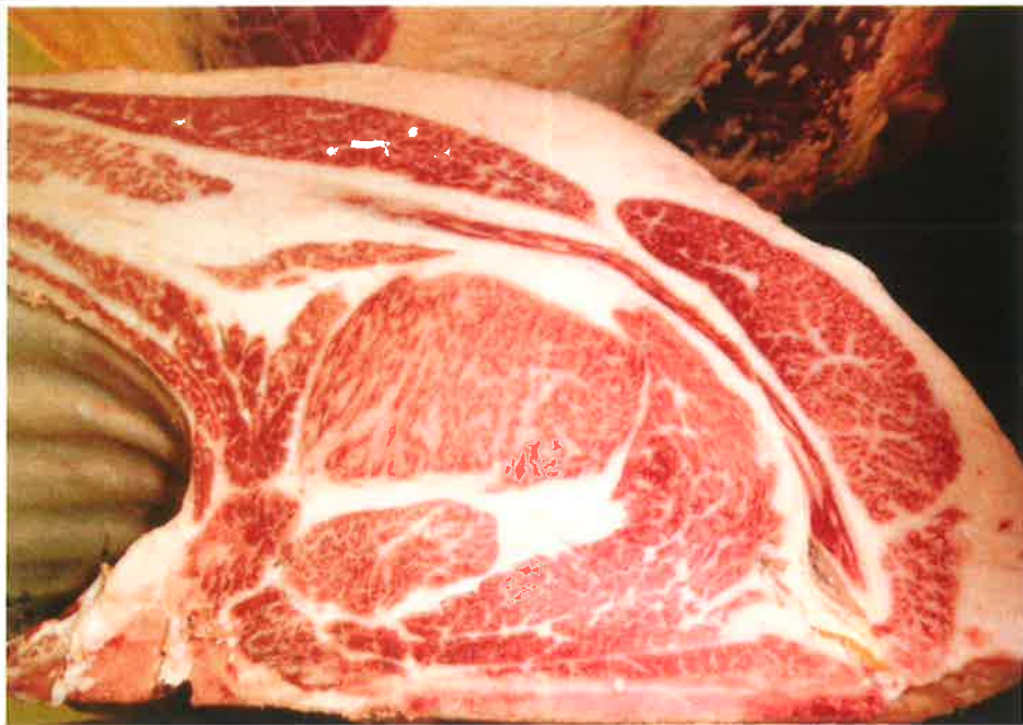
No 11 血統：忠富士×安平 格付成績：A-5 BMSNo 9