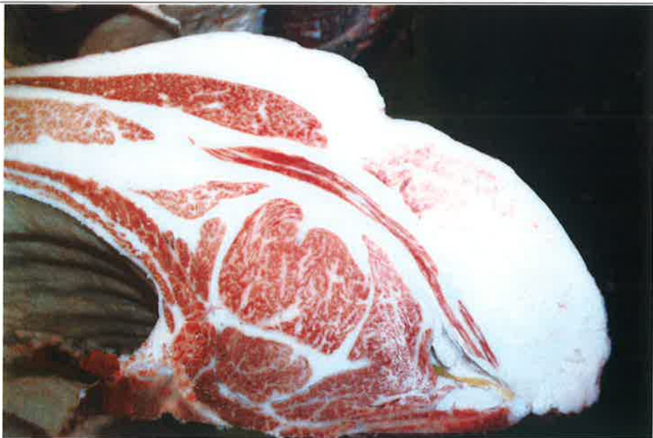
No 3 血統：秀菊安×忠富士 格付成績：B-4 BMSNo 6