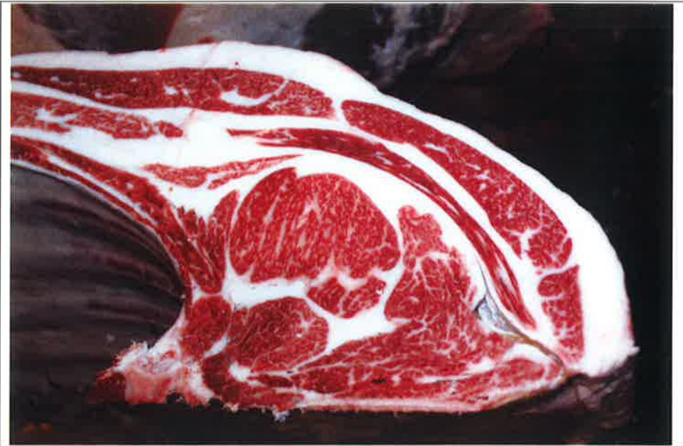
No 6 血統：秀菊安×福之國 格付成績：A-4 BMSNo 6