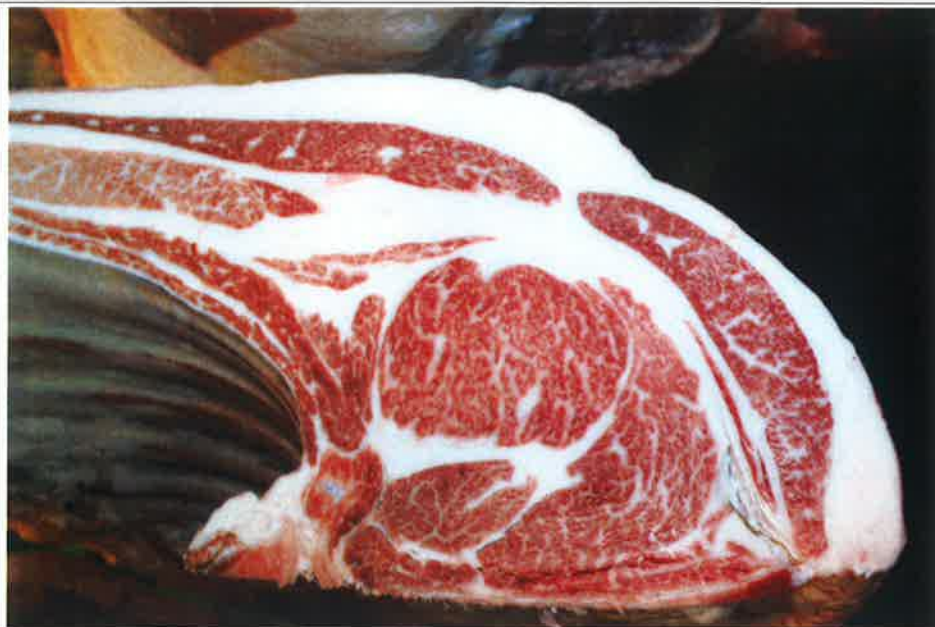
No 1 血統：美穂国×忠富士 格付成績：A-5 BMSNo 8