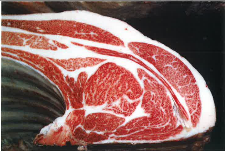
No 7 血統：忠富士×安平 格付成績：A-5 BMSNo 9