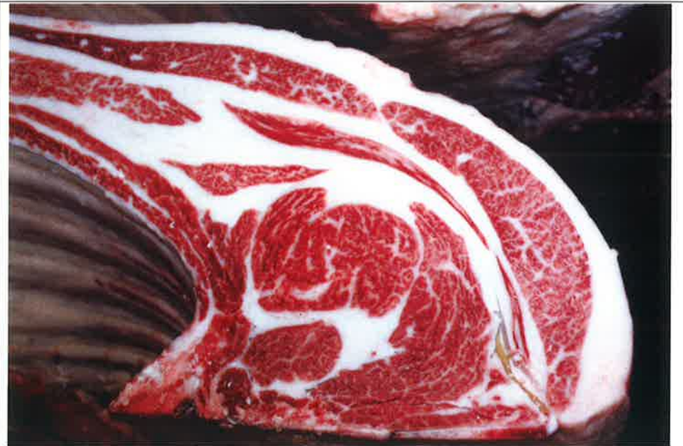
No 8 血統：糸北國×福桜 格付成績：A-4 BMSNo 6