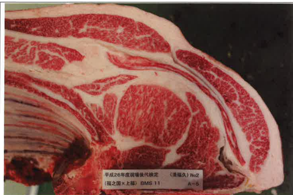
No 2 血統：福之国×上福 格付成績：A-5 BMSNo 11