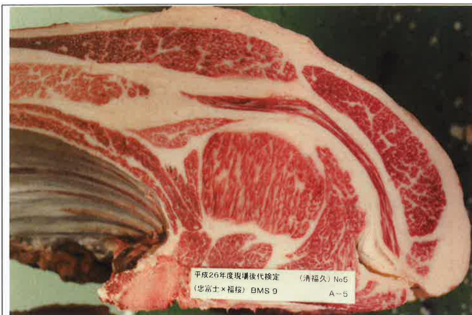
No 5 血統：忠富士×福桜 格付成績：A-5 BMSNo 9