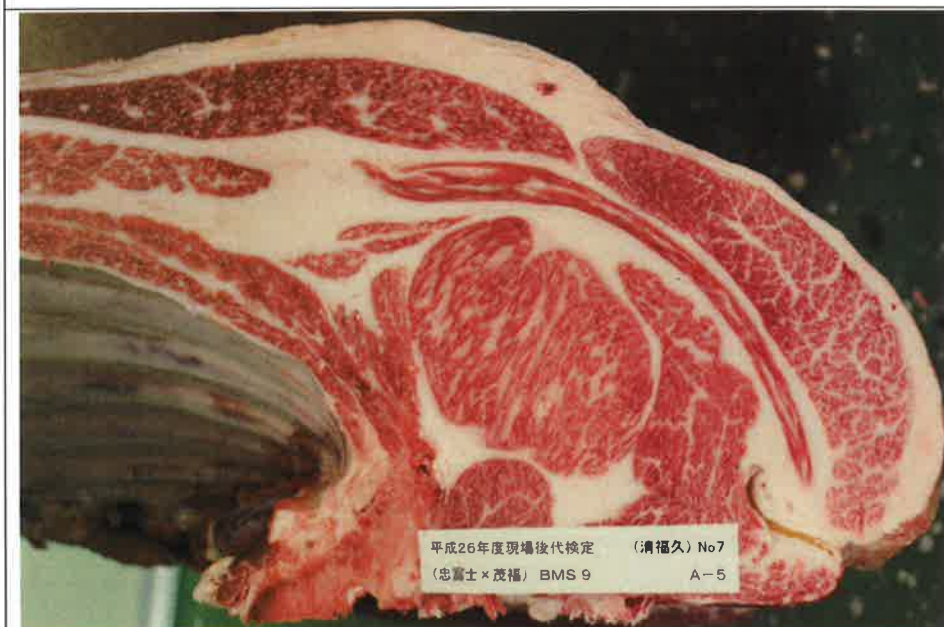
No 7 血統：忠富士×茂福 格付成績：A-5 BMSNo 9