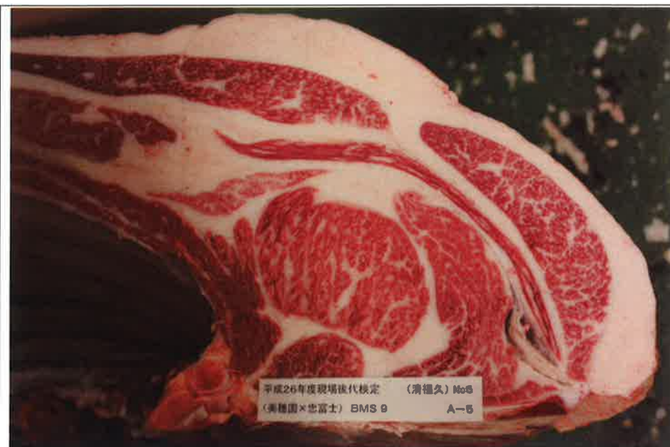
No 6 血統：美穂国×忠富士 格付成績：A-5 BMSNo 9