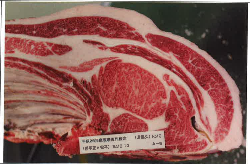
No. 10 血統：勝平正×安平 格付成績：A-5 BMSNo 10