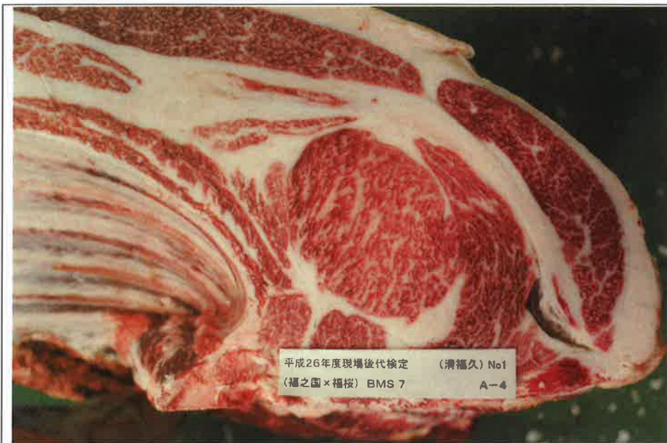
No 1 血統：福之国×福桜 格付成績：A-4 BMSNo 7