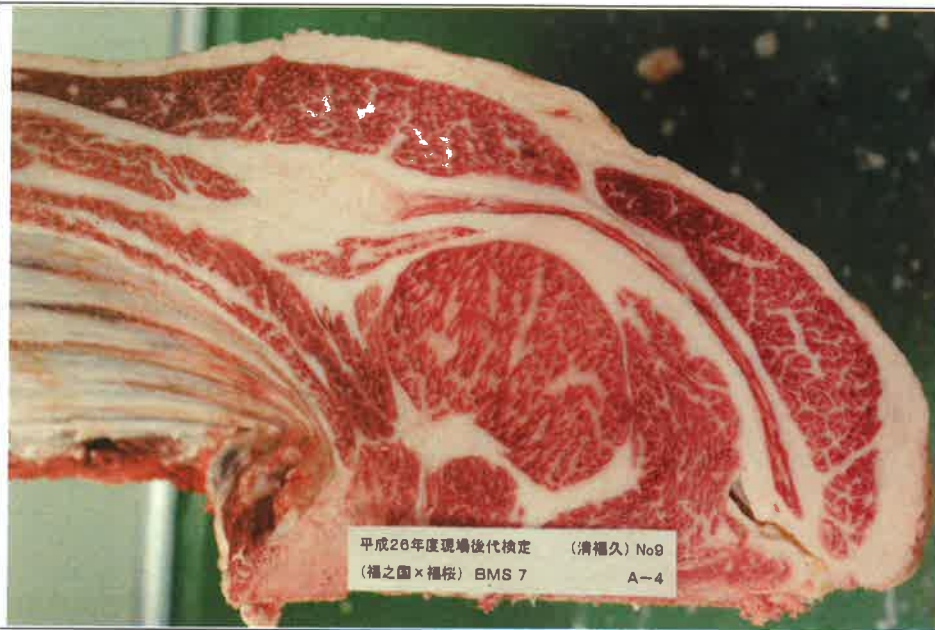
No. 9 血統：福之国×福桜 格付成績：A-4 BMSNo 7