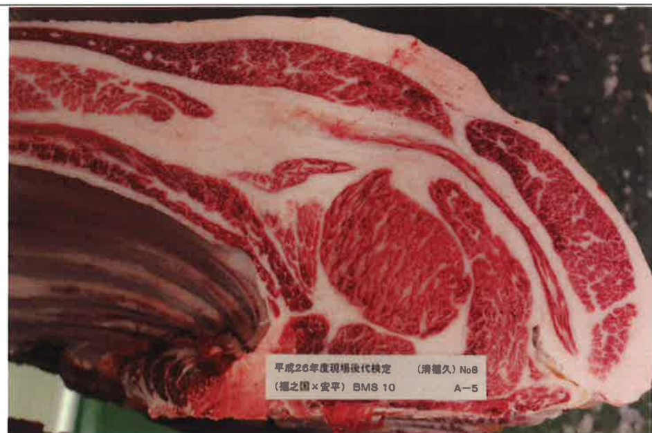
No 8 血統：福之国×安平 格付成績：A-5 BMSNo 10