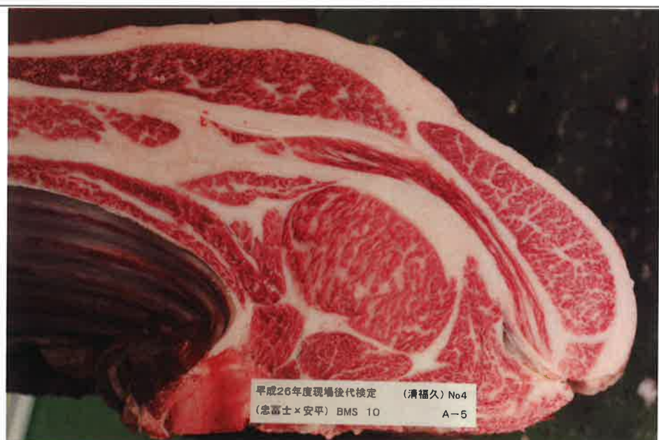
No 4 血統：忠富士×安平 格付成績：A-5 BMSNo 10