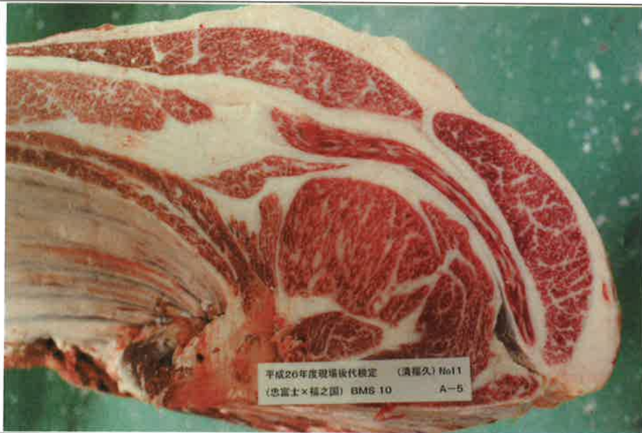
No. 11 血統：忠富士×福之国 格付成績：A-5 BMSNo 10