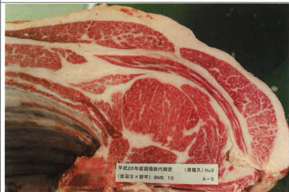
No 3 血統：忠富士×安平 格付成績：A-5 BMSNo 10