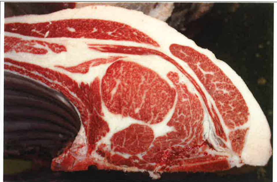
No 6 血統：勝平正×福之國 格付成績：A-4 BMSNo 5