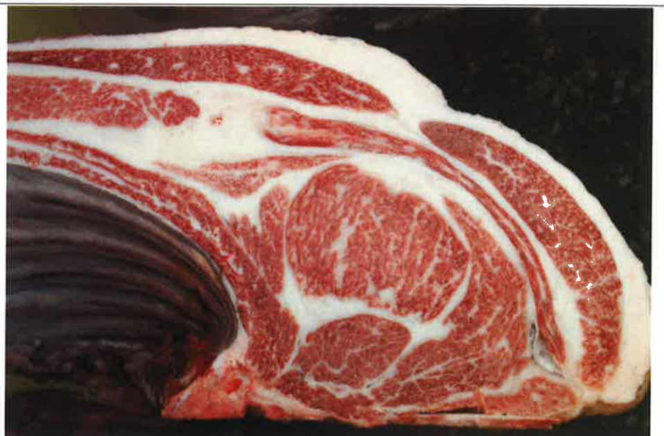
No 8 血統：美穂國×福桜 格付成績：A-4 BMSNo 7