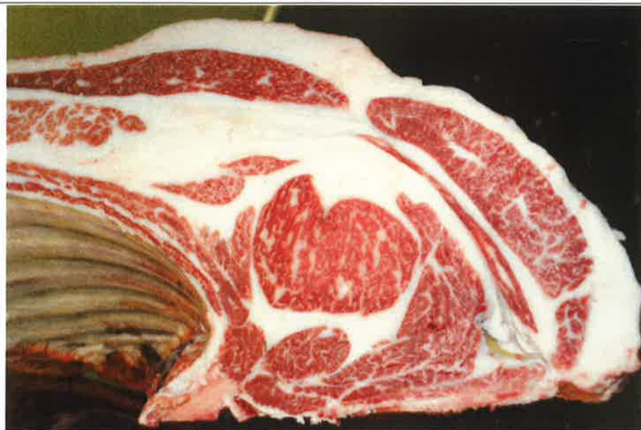
No 1 血統：福之国×安平 格付成績：A-3 BMSNo 4