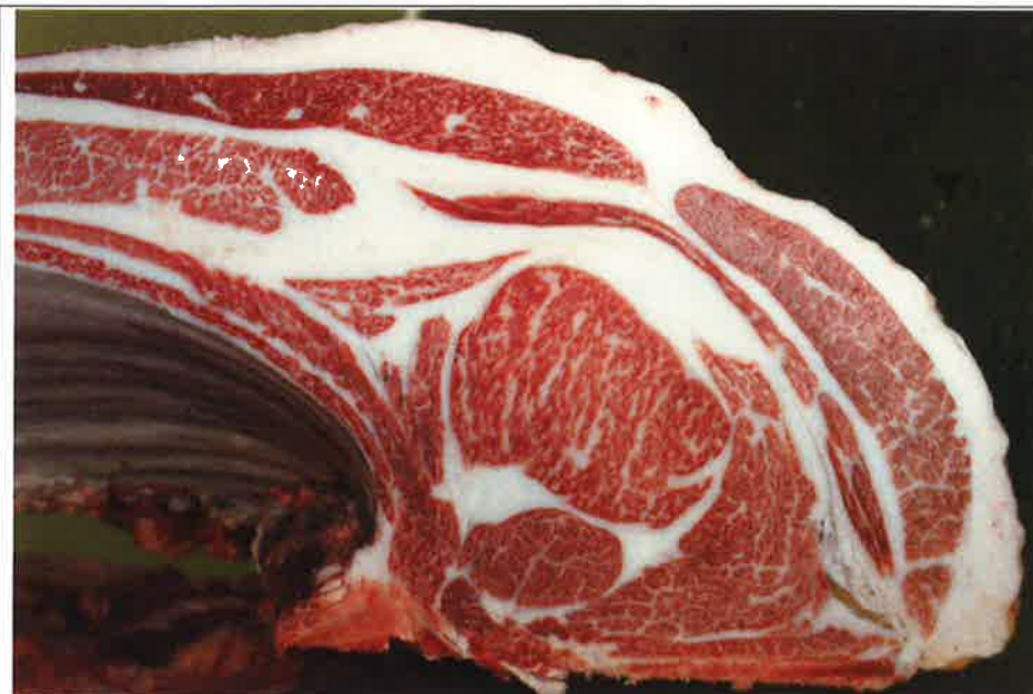
No 2 血統：福之国×安平 格付成績：A-4 BMSNo 6