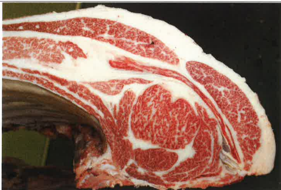
No 3 血統：忠富士×安平 格付成績：A-4 BMSNo 7