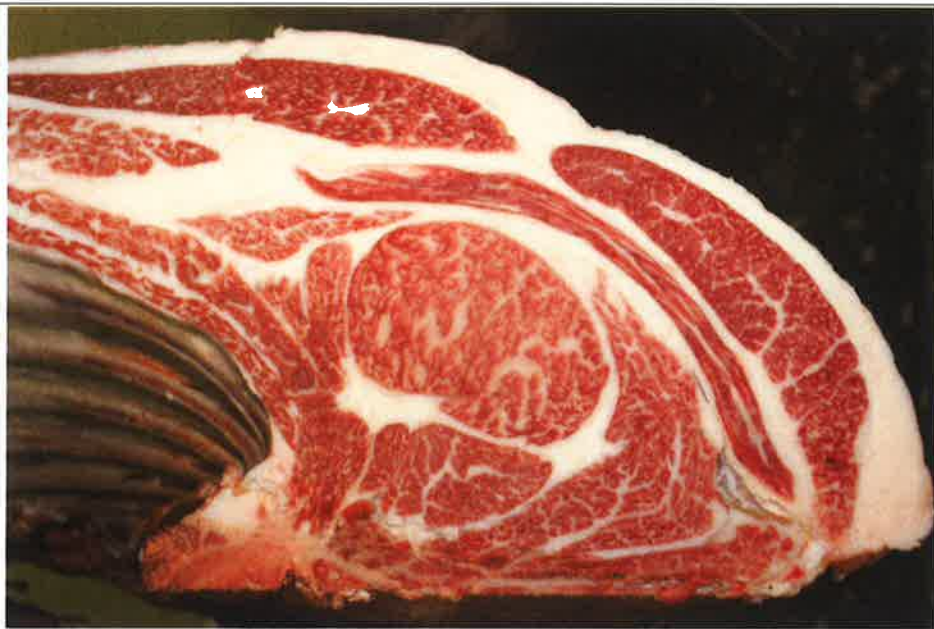
No 9 血統：福之国×安平 格付成績：A-4 BMSNo 6