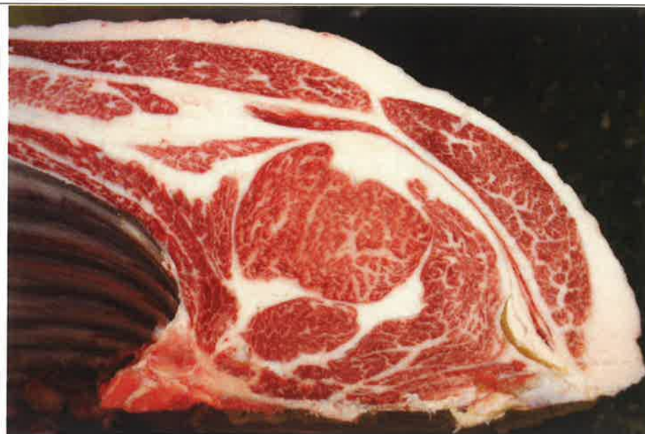
No 10 血統：美穂国×忠富士 格付成績：A-5 BMSNo 9