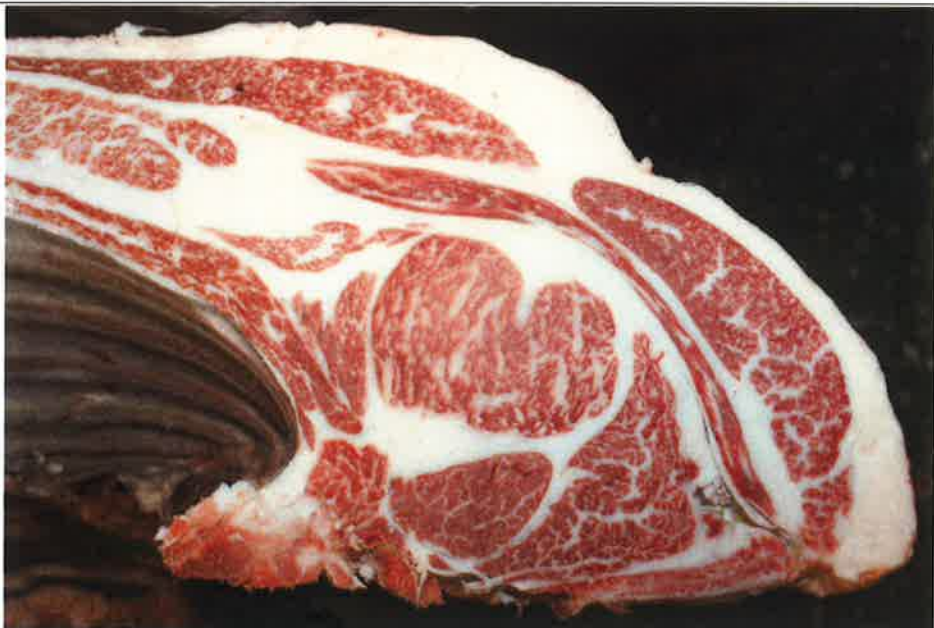
No 11 血統：忠富士×安平 格付成績：A-4 BMSNo 6