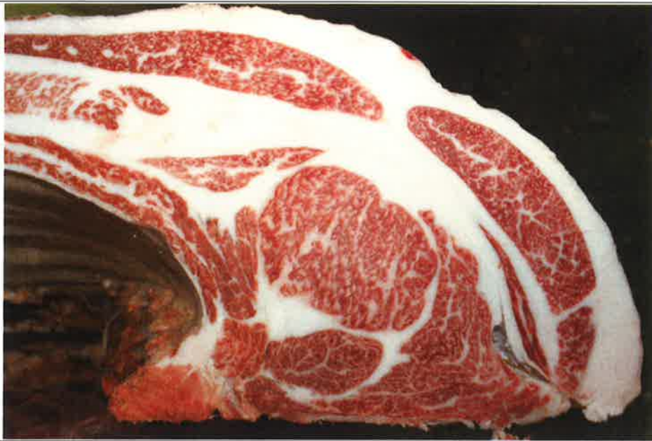
No 5 血統：勝平正×福桜 格付成績：A-4 BMSNo 7