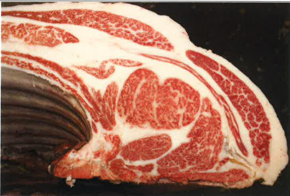
No 7 血統：糸北國×糸永桜 格付成績：A-4 BMSNo 6