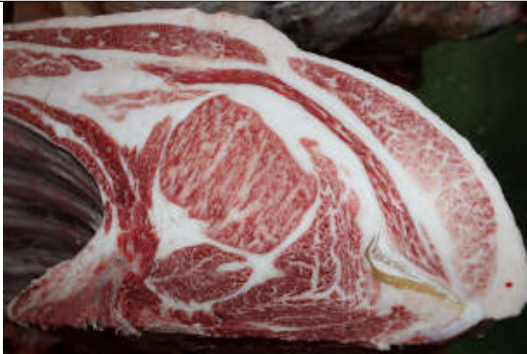
No5 血統：耕富士×勝平正 格付成績：A-5 BMS 9