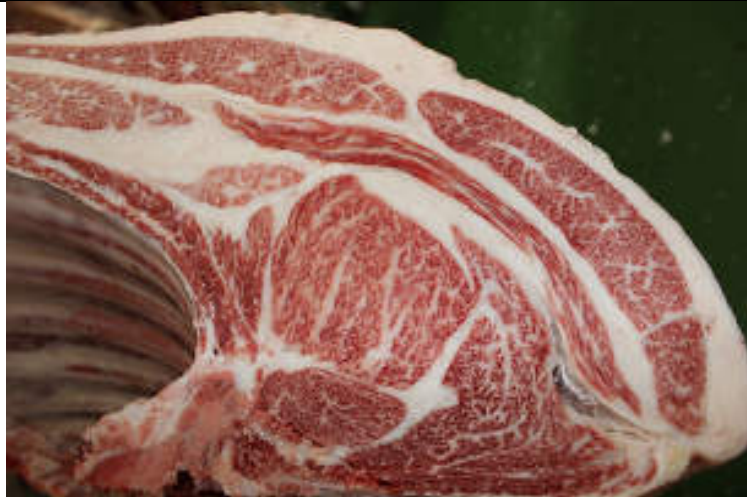
No11 血統：真華盛×忠富士 格付成績：A-5 BMS 10