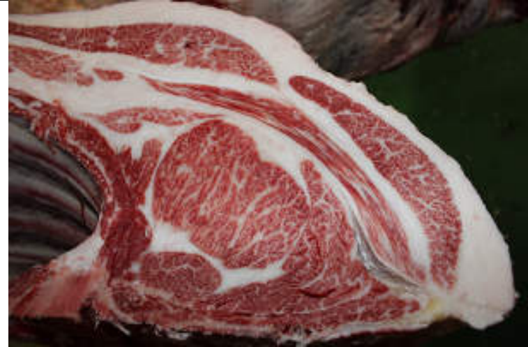
No10 血統：耕富士×福之国 格付成績：A-5 BMS 8