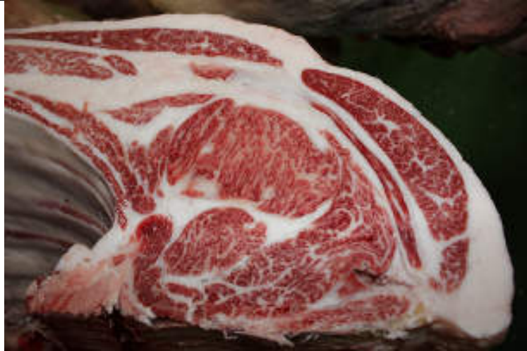
No9 血統：耕富士×国牽白清 格付成績：A-5 BMS 8