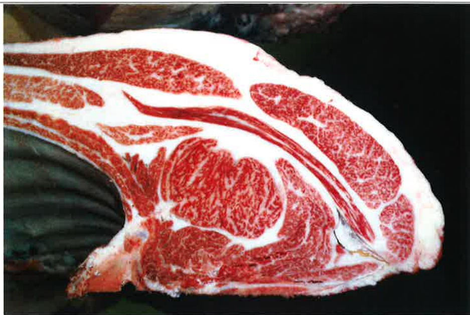
No 5 血統：勝平正×安平 格付成績：A-4 BMSNo 7