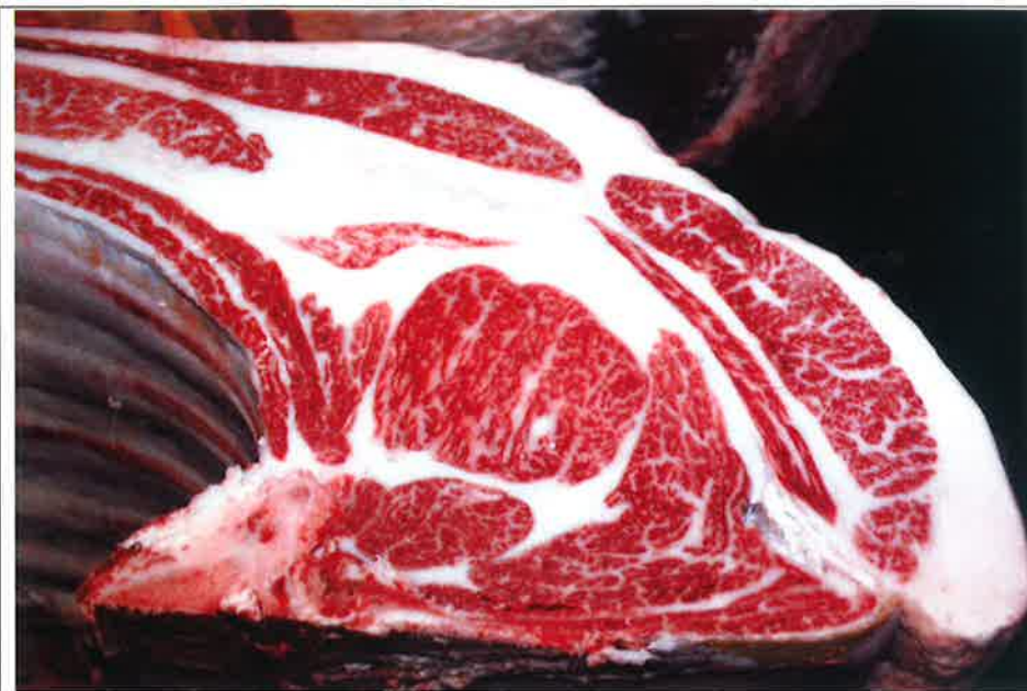
No 2 血統：福之国×勝平正 格付成績：A-4 BMSNo 6