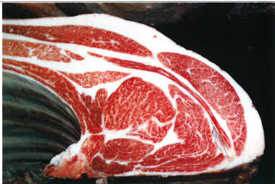
No 7 血統：忠富士×安平 格付成績：A-5 BMSNo 9