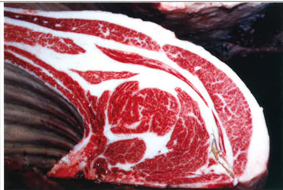
No 8 血統：糸北國×福桜 格付成績：A-4 BMSNo 6