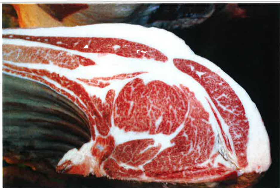
No 1 血統：美徳国×忠富士 格付成績：A-5 BMSNo 8