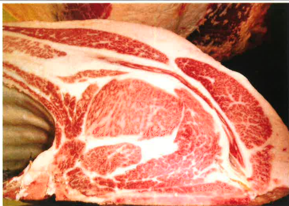
No 11 血統：忠富士×安平 格付成績：A-5 BMSNo 9