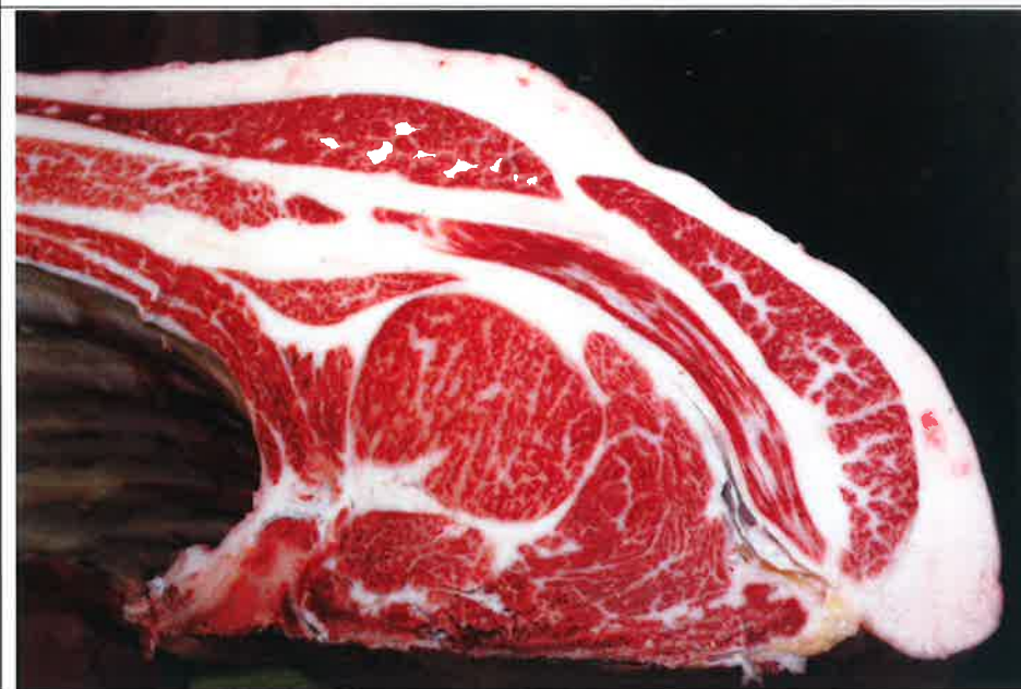
No 4 血統：忠富士×福桜 格付成績：A-5 BMSNo 8