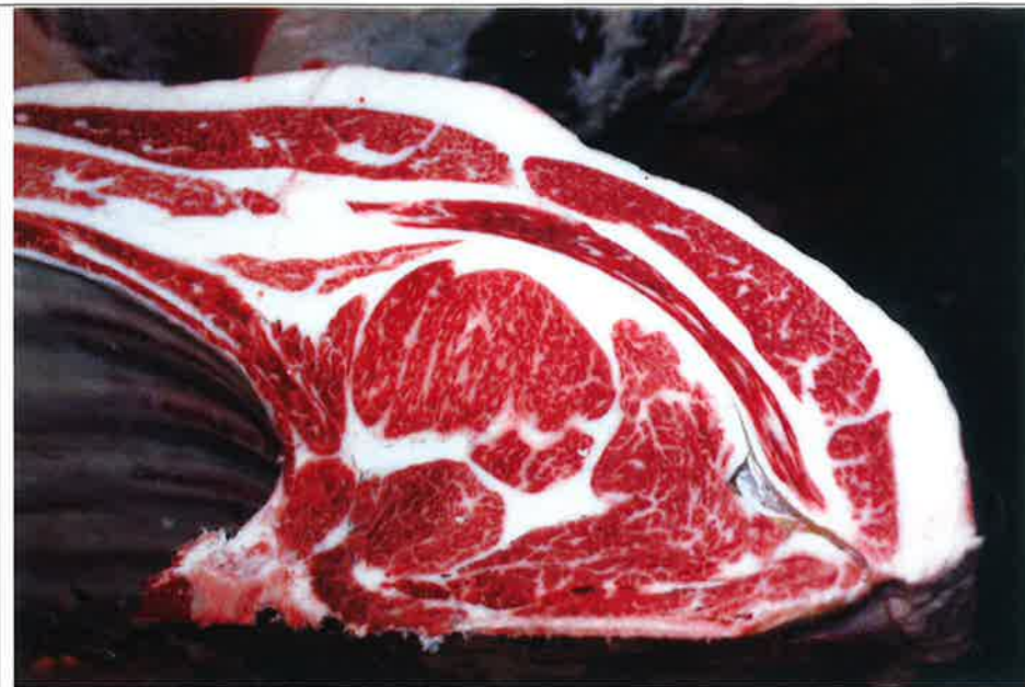
No 6 血統：秀菊安×福之國 格付成績：A-4 BMSNo 6