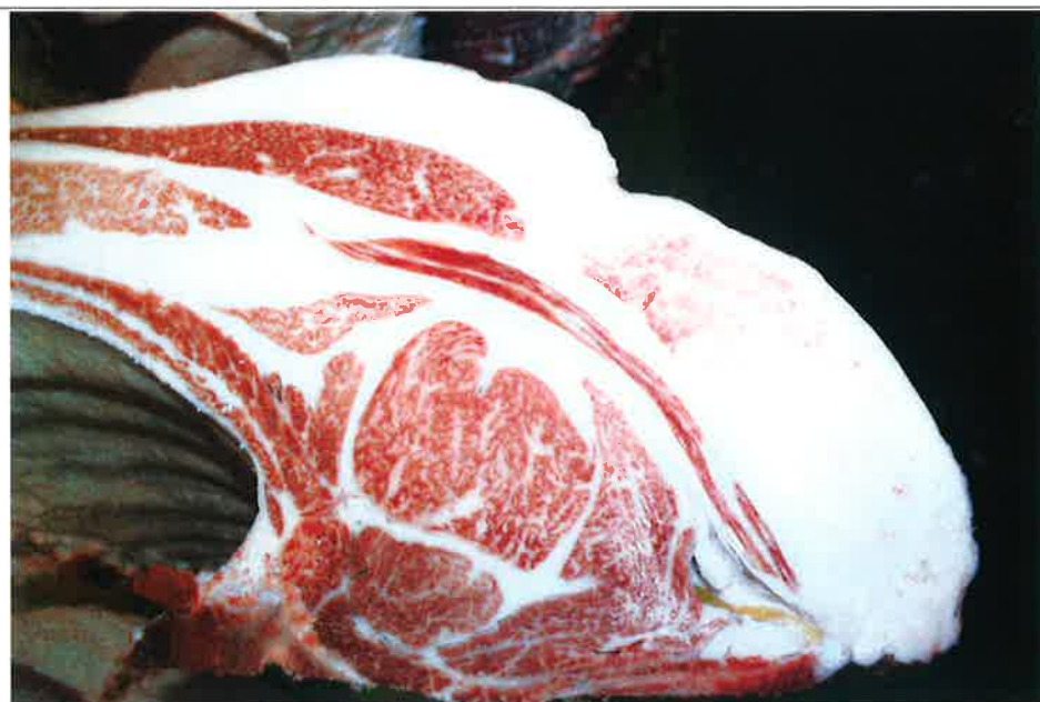
No 3 血統：秀菊安×忠富士 格付成績：B-4 BMSNo 6