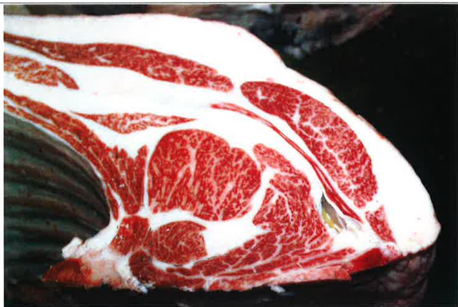
No 9 血統：安平×福桜 格付成績：B-4 BMSNo 6