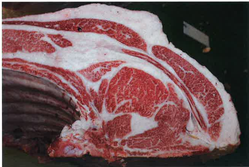
No3 血統：福之国×安平 格付成績：A-5 BMS 9