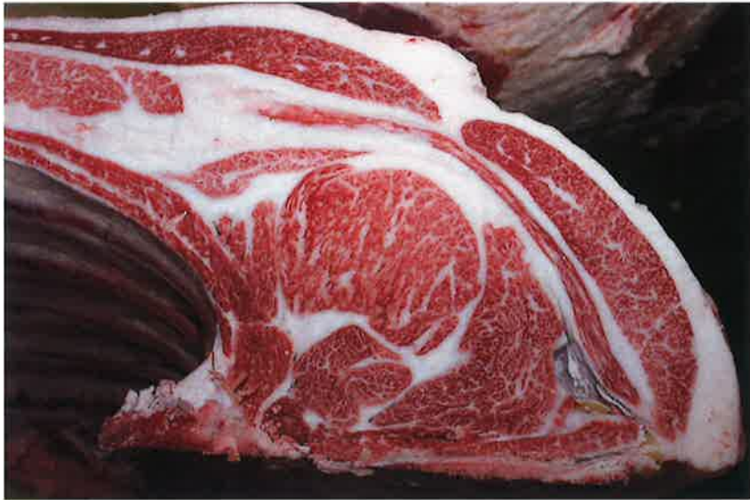
No5 血統：美徳国×勝平正 格付成績：A-5 BMS 10