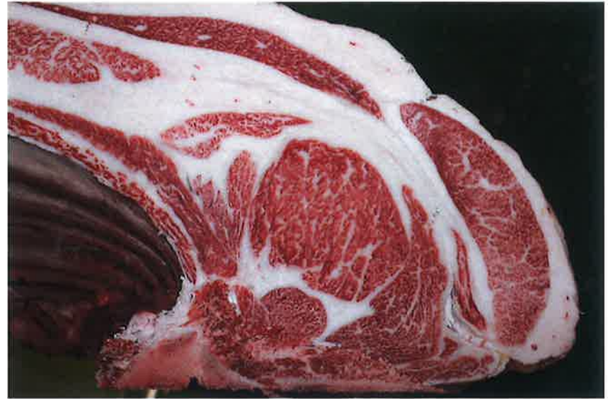
No6 血統：梅福6×忠富士 格付成績：A-5 BMS 8