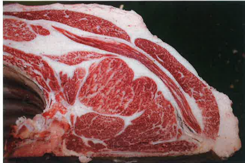
No2 血統：美穂国×勝平正 格付成績：A-4 BMS 7