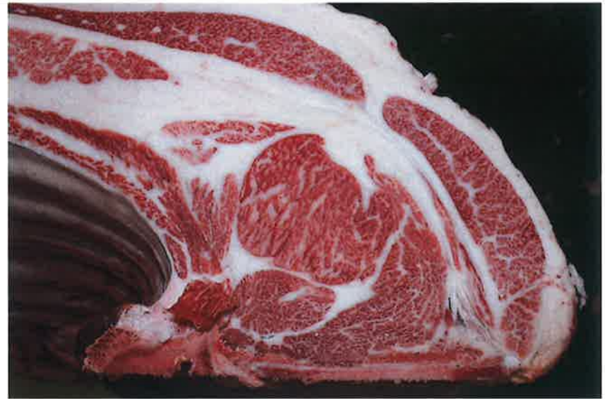
No8 血統：秀正実×福之国 格付成績：A-5 BMS 8