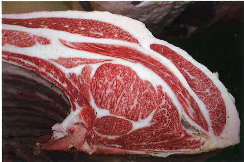
No1 血統：忠富士×安平 格付成績：A-5 BMS 8