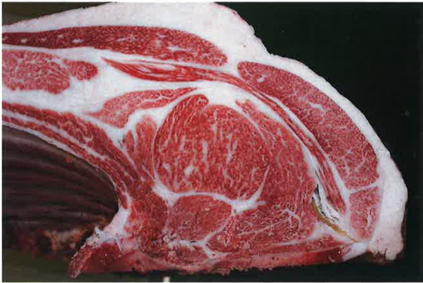
No9 血統：美徳国×福之国 格付成績：A-5 BMS 8