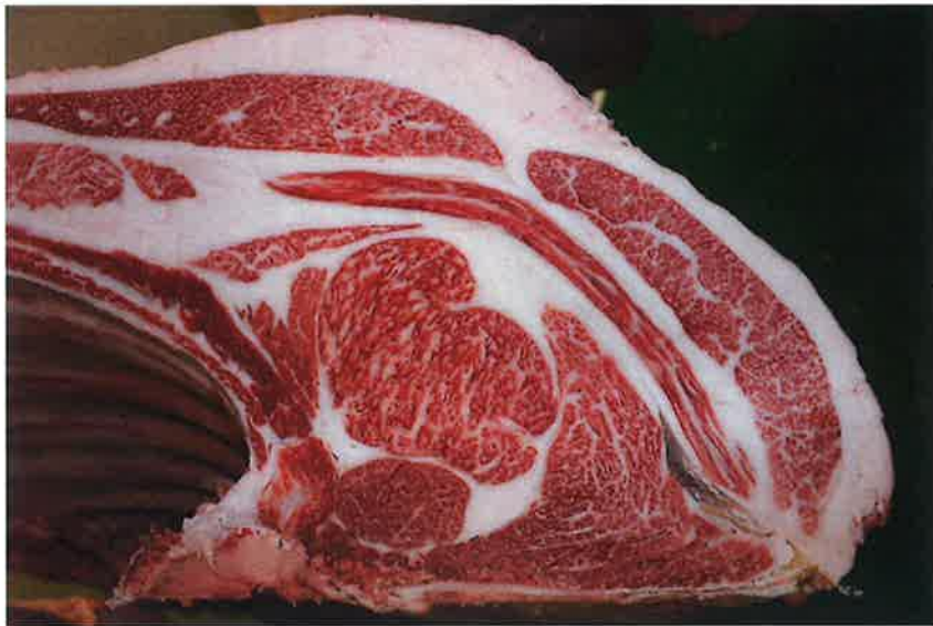
No7 血統：耕富士×日向国 格付成績：A-5 BMS 9