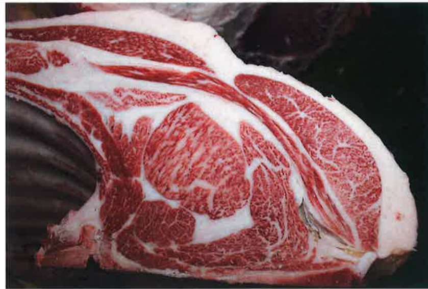
No4 血統：忠富士×安平 格付成績：A-5 BMS 9