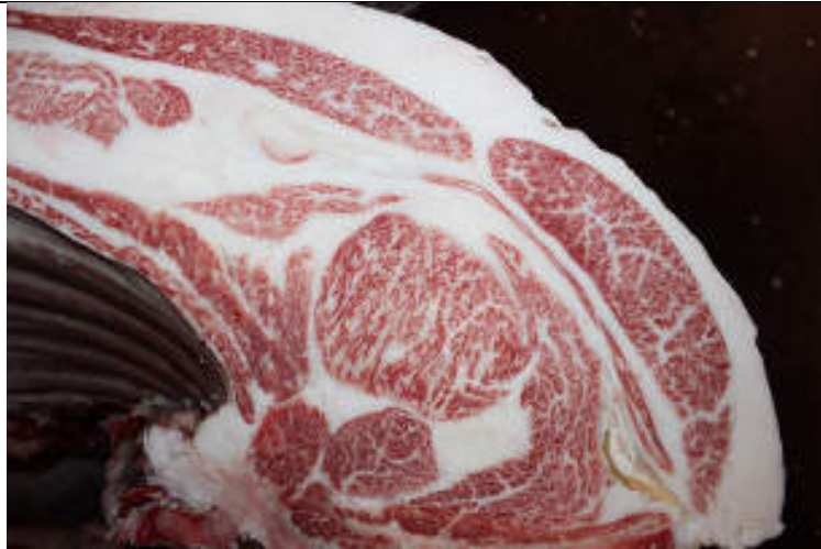
No11 血統：美穂国×秀菊安 格付成績：A-5 BMS 10