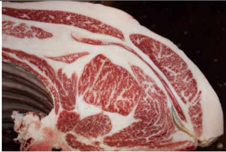
No9 血統：美穂国×勝霧島 格付成績：A-4 BMS 6