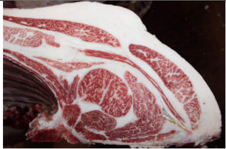
No10 血統：平忠勝×福之国 格付成績：B-3 BMS 5